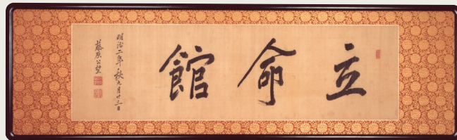
1869 (明治 2) 年 西园寺公望所书的“立命馆”

“立命”两字取自中国的古籍《孟子》尽心篇中的一段，“夭寿不贰，修身以俟之，所以立命也”，意为“有人早夭，有人长寿，这一切都是天命决定的。所以活着的时候要努力学习、修身养性，以待天命，这就是确立正常命运的方法”。因此，“立命馆”的意思就是人们确立自己正常命运的地方。