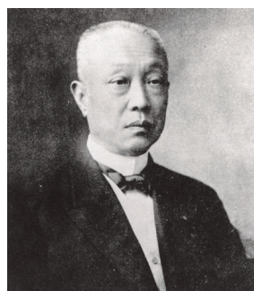
校祖 西园寺 公望 Saionji Kinmochi