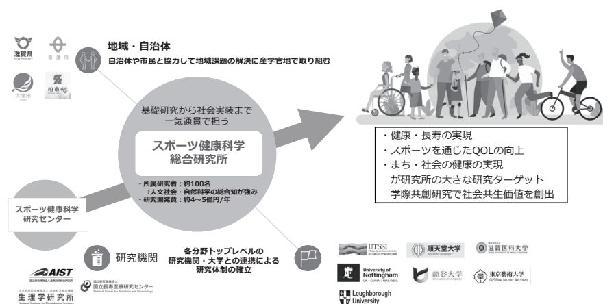
図3 立命館大学スポーツ健康科学総合研究所（2022年4月設置）

2つの研究センターでの20年間、ならびにCOIプログラムでの実績、成果により、2022年4月に常置研究機関「スポーツ健康科学総合研究所」が設置された。スポーツ健康科学分野を筆頭に、脳神経科学、理工学、情報科学、薬学、生命科学、心理学、人間科学、経済学、経営学、食科学等、幅広い分野の研究者100名以上が所属している。研究所のミッションは、あらゆる人の身体的・精神的・社会的健康の実現に主体的に取り組み、多様性と包摂性に優れ、誰もが健康的な生活を送ることのできる社会を実現することである。そのために、3つの研究ターゲット「健康・長寿の実現」、「スポーツを通じたQOLの向上」、「まち・社会の健康の実現」を設定し、あらゆる分野の研究者を連携・糾合し、産学官地の多様なステークホルダーとの学際共創研究により、基礎研究から、開発・実証、社会実装のイノベーションサイクルを構築して一貫通貫で推進している。