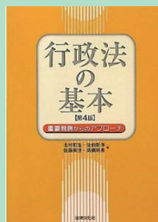
『行政法の基本—重要判例からのアプローチ』北村和生ほか 著法律文化社 2010年4月 ¥2,730