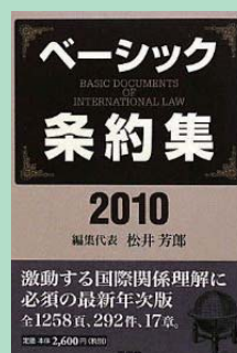
『ベーシック条約集〈2010年版〉』松井芳郎編集 東信堂 2010年4月 ¥2,730