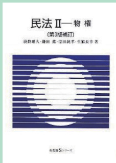
『民法Ⅱ物権 第3版補訂』 生熊長幸ほか著 有斐閣 2010年3月 ¥1,995