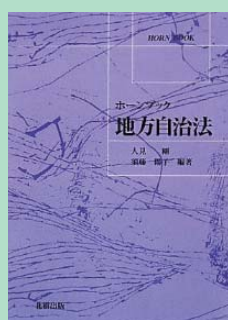
『ホーンブック 地方自治法』須藤陽子ほか著 北樹出版 2010年5月 ¥2,730