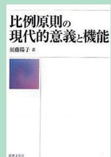
『比例原則の現代的意義と機能』須藤陽子著 法律文化社 2010年4月 ¥5,670