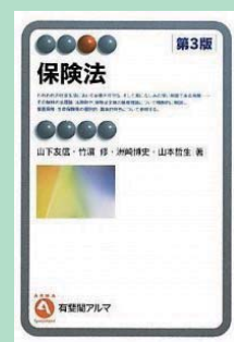
『保険法第3版』 竹濱修ほか著 有斐閣 2010年3月 ¥2,205