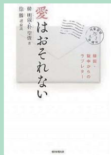
『愛はおそれない 韓国・獄中からのラブレター』徐勝 翻訳 朝日新聞出版 2010年3月 ¥1,890