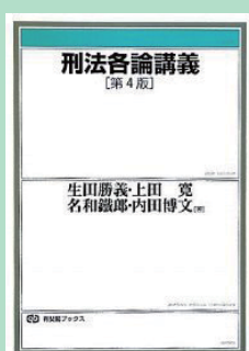
『刑法各論講義 第4版』生田勝義 上田寛ほか著 有斐閣 2010年5月 ¥2,835