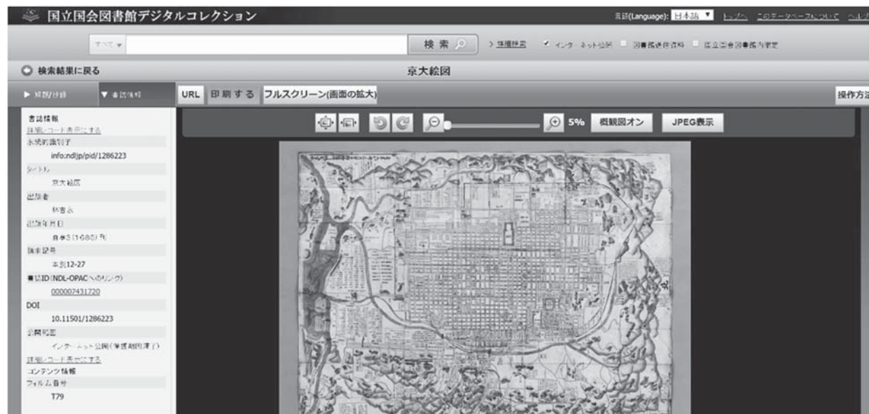
第 1 図 国立国会図書館デジタルコレクションのコンテンツ閲覧画面

そのほか、京都府立京都学・歴彩館「京の記憶アーカイブ」、立命館大学アート・リサーチセン