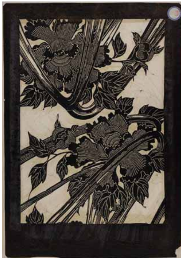
KG-3979 Edoardo Chiossone Museum of Oriental Art