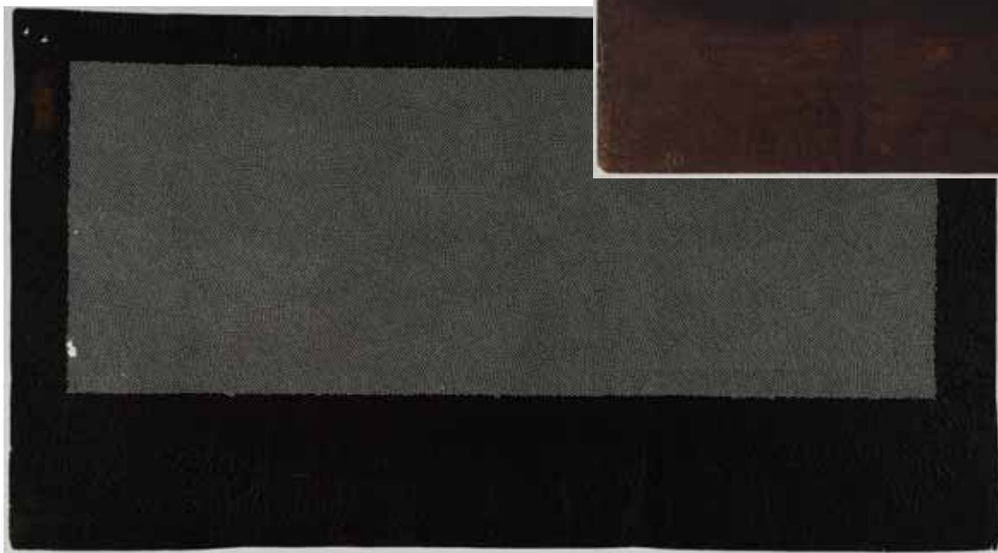
KTS00135 KYOLITE Co. collection Kyoto, Japan