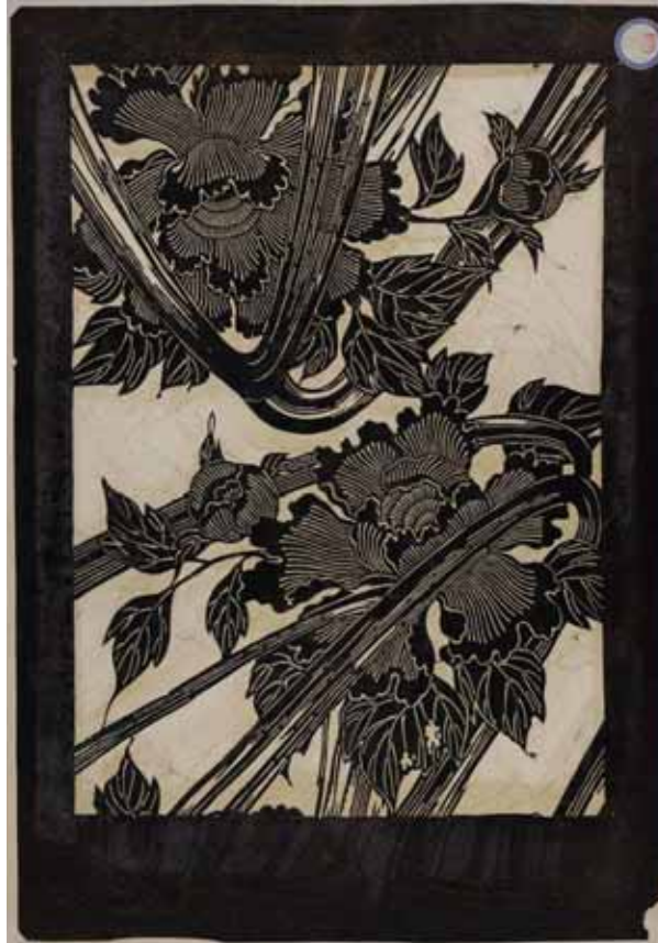
KG-3979 Edoardo Chiossone Museum of Oriental Art