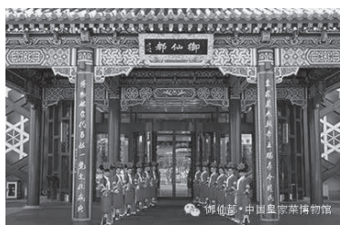
中国皇家菜博物馆餐饮厅大门

其中活态观光区别具一格，中央厨房做到开放透明、低碳节能、绿色环保呈现现代化。厨房采用玻璃幕墙，每个炉灶安装有摄像头，随时可见厨房内菜品加工、制作全程，观光者与就餐者可通过视频实时欣赏菜品制作。