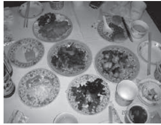
北京听鹂馆御膳之一桌菜肴

余道菜肴和400余种点心。其御膳房每天有300个御厨为她烹饪大餐，500个太监为她准备用膳，每天正餐都有百余种菜。曾在慈禧身边的女官德龄在她所著的《御香缥缈录》书中写到：“慈禧用膳时，满意的留下，大多数菜肴看看就撤下，赐给宫女及上层太监，她用御膳炫耀其自己至高无上的地位。”