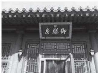
北京故宫博物院中的御膳房

出统治者的奢靡饮食，促使宫廷御膳快速发展；待到周朝，由于政治、经济、文化全面发展，便制定了较完整的宫廷御膳制度，宫廷御膳得以全面形成。