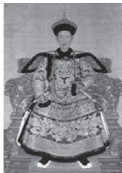
乾隆皇帝朝服画像