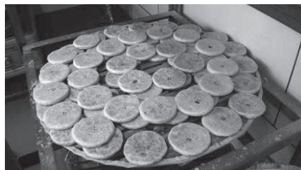
御膳糖饼 (道光皇帝所爱)

(4) 2014年7月2日，为纪念北京老字号全聚德迎来150周年华诞，“全聚德博物馆”正式对外开放。展览分“序厅”、“百年老字号”、“诚信德天下”、“食鸭品文化”4个展区，通过500余件实物、照片和资料，全面真实地记载着全聚德从1864年创建，到如今成为世界闻名老店的风雨历程。全方位地为参观者呈现出一场专业、严谨、精彩的展览。