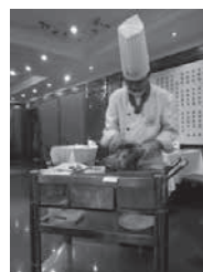
全聚德烤鸭切片中