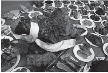
游牧民族喜欢的烧烤羊肉御膳

由于各王朝统治者都追求口腹之欲，重视宫廷御膳。中国的宫廷御膳，在中华饮食文化的历史长河中，也经历了由粗至精、由简至繁、由朴素至豪奢的发展历程，进而形成了延绵不绝、逐步发展、自我完善之历程，北京的宫廷御膳也不例外。有如俗语所云：“流水的王朝，铁打的御膳”，使其不断发展。由于北京的宫廷御膳注入了异民族饮食文化而具备丰富多彩、内涵厚重之特点。