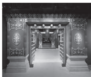
中国皇家菜博物馆的入口