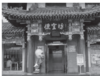
北京焖炉烤鸭技艺博物馆大门