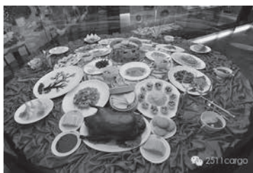
北京御膳中焖炉烤鸭

该馆以铜雕形式展示着饲养、开生、制胚、焖炉烤制等烤鸭流程，简明生动。在其120平方米的展示区内，各个年代的历史遗存物品40余件，见证了便宜坊592年的历史。便宜坊的烤鸭菜肴也是宫廷御膳之一种，系中国国家级非物质文化遗产。