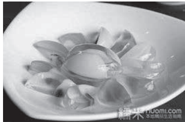
“十全乾隆御膳”之鸭草鸡皮蛋