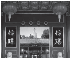
北京北海公园内的仿膳饭庄

宫廷御膳历史悠久、博大精深，丰富了中国的饮食文化，然而至今少有系统的博物馆展示，偌大的故宫博物院也没有御膳馆，20世纪80年代以前，只有为数不多的宫廷御膳餐馆，设置于风景如画的公园、王府、四合院内，略有展示，如北海公园内有“仿膳饭庄”，仅见其格格起舞迎宾、在院内烤制烧饼以及室内摆放着皇族所用的餐桌、餐椅、食器等。其它尚有颐和园中的皇家菜餐饮店“听鹧馆”，白家大院里清太祖努尔哈赤次子官府御膳等，均说不上博物馆性质的展示。