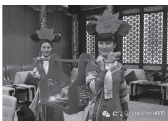
宫廷御膳包间上桌情景