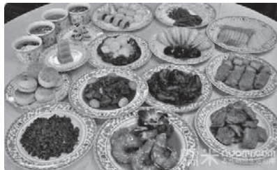
仿膳的宫廷御膳一品