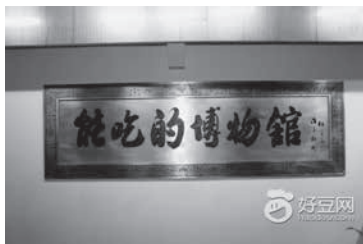
能吃的博物馆招牌