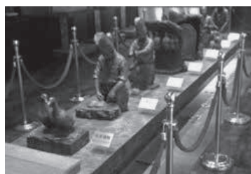
北京焖炉烤鸭技艺博物馆铜雕一景

该馆以铜雕形式展示着饲养、开生、制胚、焖炉烤制等烤鸭流程，简明生动。在其120平方米的展示区内，各个年代的历史遗存物品40余件，见证了便宜坊592年的历史。便宜坊的烤鸭菜肴也是宫廷御膳之一种，系中国国家级非物质文化遗产。