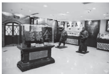
全聚德博物馆一展室