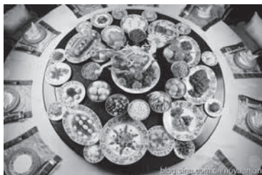
宫廷御膳之一桌冷盘