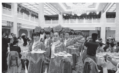
宫廷御膳大型宴会礼仪上菜一景