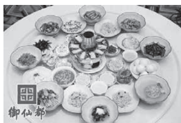
中国皇家菜博物馆的菜肴