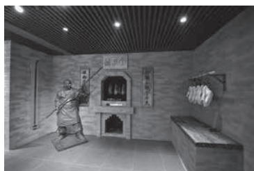
全聚德博物馆一角

(4) 2014年7月2日，为纪念北京老字号全聚德迎来150周年华诞，“全聚德博物馆”正式对外开放。展览分“序厅”、“百年老字号”、“诚信德天下”、“食鸭品文化”4个展区，通过500余件实物、照片和资料，全面真实地记载着全聚德从1864年创建，到如今成为世界闻名老店的风雨历程。全方位地为参观者呈现出一场专业、严谨、精彩的展览。