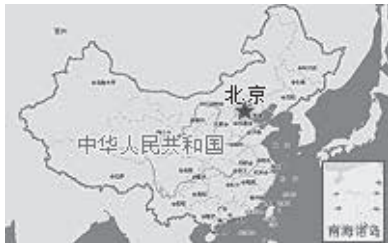
北京在中国地图上的位置

中国版图犹如一只雄鸡，东北和华北分别是头部和身体，构成中国关键的两个组成部分，而新疆、西藏等地则似雄鸡的蓬松羽毛，正是雄鸡的尾部。北京正好处于中国的咽喉部位，所以它被称赞为龙盘虎踞、地势雄伟、水甘土厚，物产富饶的天府之地。有鉴于此，北京便成为不少王朝钟情之地。