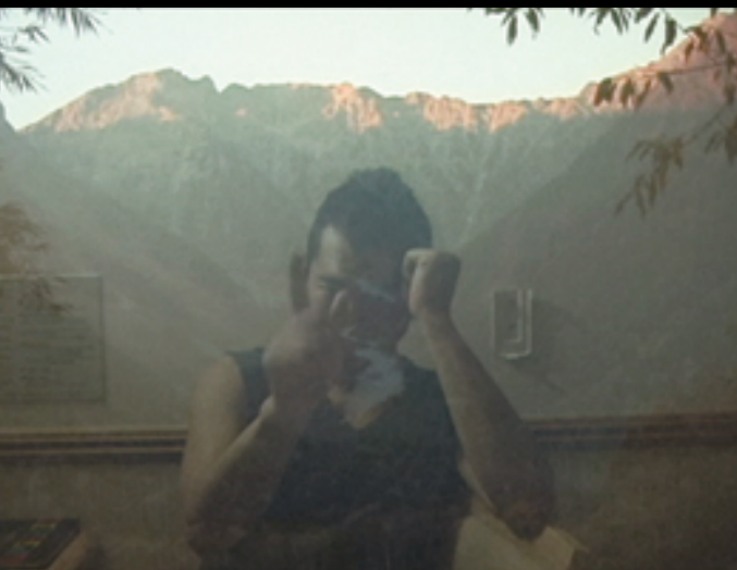
《ウム / オム 1》2005, VIDEO Hiroyuki OKI