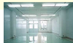
試作開発室タイプ