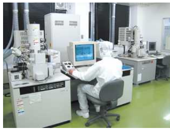
マイクロシステムセンター(解析室)