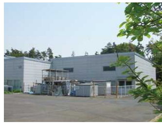
ハイテクリサーチセンター (エコ・テクノロジー研究センター)