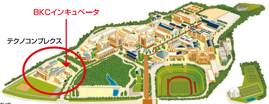
立命館大学びわこ・くさつキャンパス