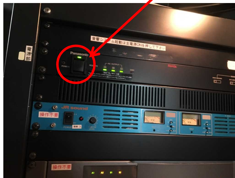
音響システムの主電源

音響システムの主電源を最初に起動してください。 ※退出時には電源が切れているか必ず確認してください。