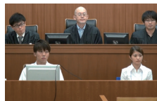
裁判員心理分析のための模擬裁判