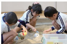
幼児の発達を理解するための行動観察