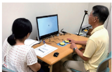
高齢者の認知機能に関する実験