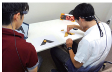
支援や教育のための生理指標の利用