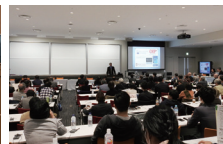
実務家や市民を交えたシンポジウム

人間科学研究所では、現代社会の多層的な社会的問題群に対し、「基礎—理論—大学」と「応用—実践—現場」の2つの柱を軸とし、縦断的な3つの研究プロジェクトが実働しています。各プロジェクト内の連携は、異なるディシプリンを持った研究者間の協働によって支えられています。