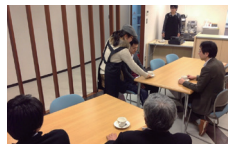
障がい者の就労支援のための実習