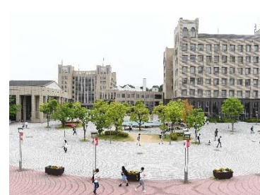
実験場所： セントラルサーカス(屋外)