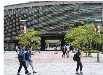
実験場所： セントラルアーク(屋外)