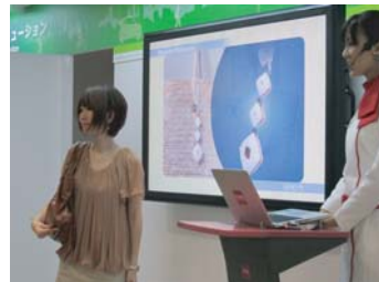
ヘルスケア向けUVセンサのデモ