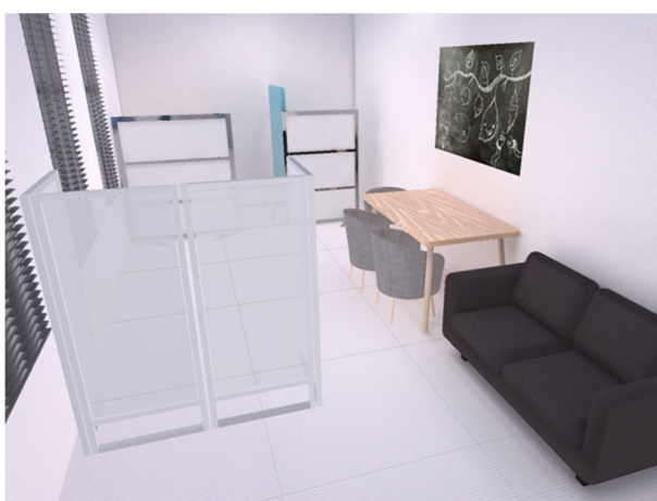
デジタルサポートルーム