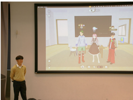
アバターを活用した授業