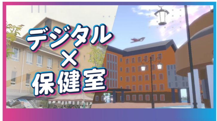
デジタル保健室の紹介動画

デジタル保健室： https://www.mrc.ritsumei.ac.jp/2023/11/07/post-71877/