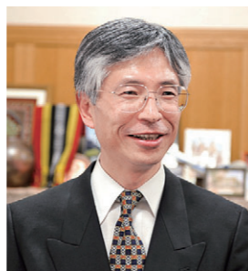
立命館大学大学院国際関係研究科長 立命館大学国際関係学部長

本研究科はまもなく設置20年をむかえますが、不断に教育・研究のあり方を追究し、多くの有為な人材を文化都市京都の地から送り出していきたいと考えています。