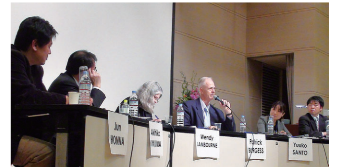
2010年度国際シンポジウム「新しい平和学の構築に向けて」でコメントーターを務める前期課程院生

等については、国際関係研究科のウェブサイトでご覧することが出来ます。その他、学内で実施される国際シンポジウム等の場でも、博士課程前期・後期課程の院生がその知見を報告する機会があるほか、立命館大学国際関係学会院生部会を中心とした院生研究会も、それぞれの研究成果を報告し、ブラッシュアップする機会になっています。