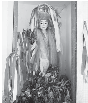
写真14. バガン郊外エイヤーワディー川 （イラワジ川）沿いのガンジーシンの祠

この祠には一柱のご神体のみ。頭上、右手、祠の扉の取っ手の左右に船から交換のために取り外された紅白の布が巻きつけられている。