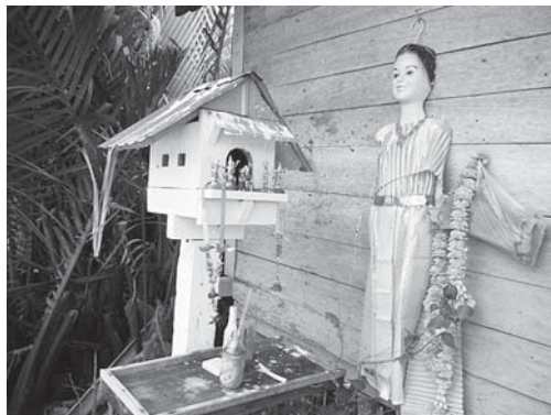
写真7. メー・ヤー・ナンの像と祠 (写真6と同じ造船所にて)

タイの伝統的衣装をまとった若い女性のイメージ。河口に向い合うように建てられている。