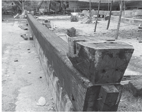
写真6. 船の材料となるタキアン木 (ナコンシータンマラート県P地区内造船所にて)

しかし、前述のT氏は、メー・ヤー・ナンの語源は「ヤー・ナン」の木ではないかと言う。ヤー・ナン木の蔓は蔦状で粘り気があり、薬草にも食用にもなる。T氏によると、この地域の船霊信仰は、以前は布の代わりに、あるいは布とともにこの木の蔓を船首に巻きつけていたと年寄りから聞いたことがある。またメー・ヤー・ナンは実体化したイメージが存在しないと述べたが、T氏によると、メー・ヤー・ナンはタイの伝統的衣装を身にまとった、髪の毛の長い30代くらいの美しい未婚女性のイメージなのだそうだ。なぜ若い未婚女性かというとメー・ヤー・ナンは優しい神様だからである。他方、神が「年老いた女性」の場合、性格が荒々しくなるからだと言う (写真7参照)。