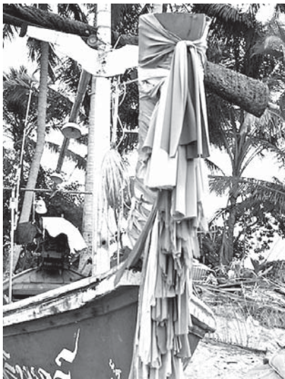
写真 8. ナコンシータンマラート県ムアン郡ターサーラー地区漁村のメー・ヤー・ナーン コーン（船首）部分が長いので、ムスリム所有の船と思われる。古い布を捨てることなく、新たに布を巻 いている。巻かれている布の色も多彩である。