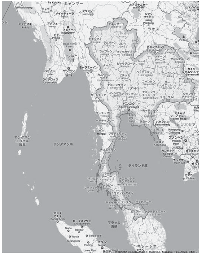
地図 1. タイおよびミャンマー東南部 (Googlemap より引用)

ではマレー語のクランタン方言が使用され、イスラーム教育もソンクラー以外ではマレー語で行われている (木村・松本 2005: 88-89)。しかし、本論文での調査地であるナコン・シータンマラート県、ならびにラノン県では、ムスリムは少数派であり、またタイ語を母語とする人々が多く、タイ語でイスラーム教育を行っている 5) 。