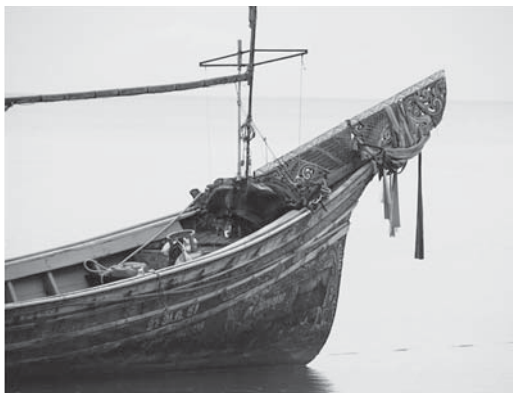
写真 9. ナコンシータンマラート県ムアン郡ターサーラー地区漁村。 ゴレ船のメー・ヤー・ナーン

ゴレ船は、南タイ・ムスリム漁民独特の装飾・彩色を施した漁船。通常、ゴレ船を使用するのは、深南部 パタニー県、ヤラー県のムスリム漁民であり、ナコンシータンマラート県で見かけるのは珍しい。所有者（ム スリム女性）が、パタニーに住む親族から購入したものであると言う。