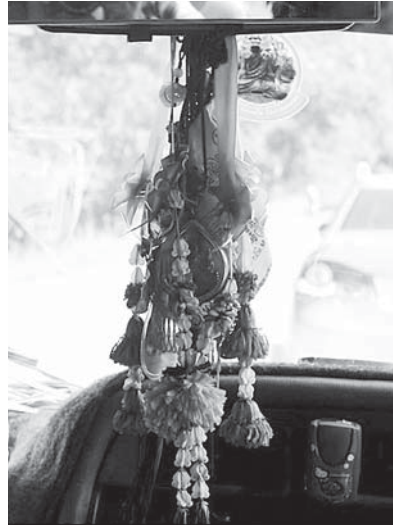
写真3. 車に飾られたメー・ヤー・ナーン (バックミラーに吊るされた花輪)

トラックやバス等の運転手を職業とする人々の間にも信仰が広がっている(写真3参照)。メーとは「母」を意味し、ヤーは「父方の祖母」、ナーンは「女性」を表すが、信仰する漁民の間で、必ずしも高齢や既婚の女性がイメージされているわけではなく、「女性の精霊」であること以外に言葉にはあまり意味がないようである。インフォーマントへの聞き取りではメー・ヤー・ナーンを若い未婚女性とイメージするケースが多かった。ただし、観音像のように、崇拝の対象となるようなパターン化した神像が存在するわけではない。