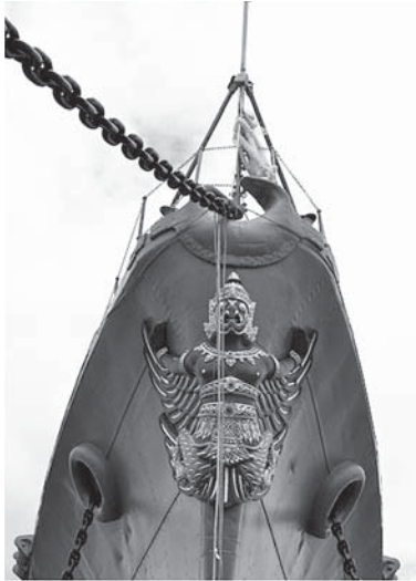
写真2. 船首にメー・ヤー・ナーン信仰の 布が巻かれたタイの軍艦 (サムットプラカン県海軍基地内にて)