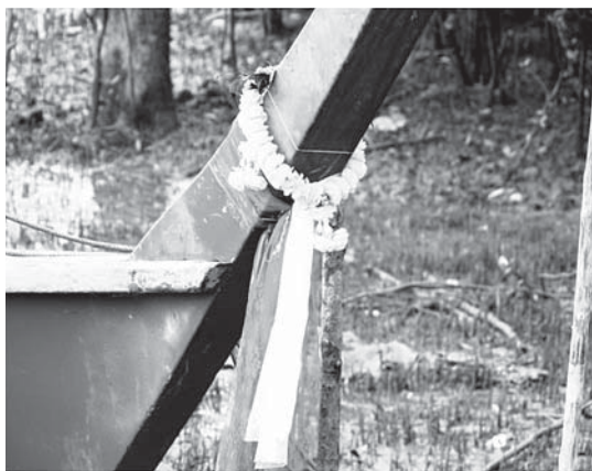
写真1. 船の船首部分に飾られたメー・ヤー・ナン（ラノーン県ムアン郡にて） 下から青、赤、白の三色の巻布の上に、マリーゴールドの花が飾られている。

メー・ヤー・ナンとは「船に宿る精霊」いわば「船霊（船玉）」である。船を水難事故から守り、豊漁を導くとされる。メー・ヤー・ナンを信仰する船は、その船首に色鮮やかな布（通常三色か五色）を巻き、マリーゴールド等の花を飾る（写真1参照）。特にタイ南部の漁船の色とりどりのメー・ヤー・ナンは有名で、南部の象徴として観光パンフレットに載るほどである。しかし実際は、メー・ヤー・ナン信仰は、タイ南部だけではなく、水路交通が盛んであった中部の住民や、東部の沿岸部漁民や・船乗りの間でも古くから信仰され、タイ国民にとって、非常に身近な信仰である（写真2参照）。陸路交通が主たる輸送手段である現代では、