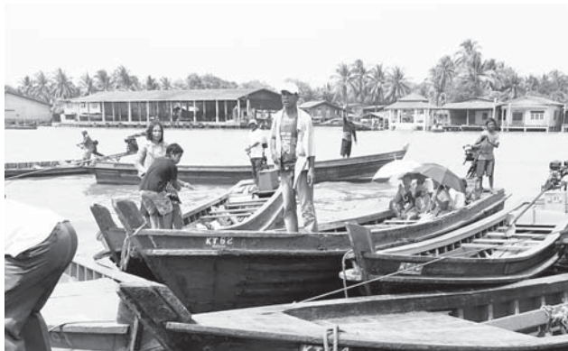
写真12. ラノーの港に停泊するミャンマーの船 船首部分に紅白の布が巻いてある。

ラノー県は、狭い海峡を経て、ミャンマー領コータウンと向い合っており、近年、ミャンマーとの交易が盛んな地域でもある。ラノーの港には、ミャンマー側と行き来する客を乗せた船や漁船が行き来する。これらの船にも船霊信仰を表す布が巻かれている（写真12参照）。コータウンの漁民社会でも船霊信仰は盛んである。船霊は船首に宿るとされ、布を巻くことで船霊への畏怖を表現する。写真12から分かるように、タイ漁民同様、船首部分に布を巻き船霊への畏怖を表現する。しかし、コータウンの船霊は「ウー・シンジー」というナット神（男神）である。このウー・シンジーは、バガン時代に決められた「37の公式ナット」には含まれない