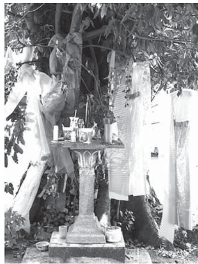
写真5. ラーブリー県バーン・ポーン郡内、別の寺院境内のタキアン木（2）

女性の精霊であるため、願いことが叶った者により、木の幹に女性用ドレスが吊るされている。