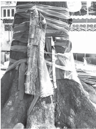
写真4. ラーブリー県バーン・ポーン郡内、寺院境内のナーン・タキアン信仰（1）

中部タイ、ラーブリー県バーン・ポーン郡の寺院境内には、タキアンの古木が保存されており、ナーン・マイとして村人の信仰の対象になっている（写真4および5参照）。願い事の多くは、宝くじの当選番号透視など現世的な内容が多く、願いがかなった場合は御礼として女性