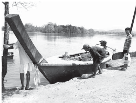
写真10. ラノーン県ムアン郡G地区におけるムスリムの船のメー・ヤー・ナン（1） 船首部分が長いのが特徴。