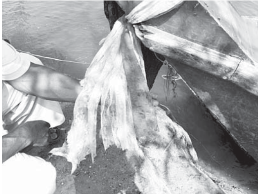
写真 11. ラノーン県ムアン郡 G 地区におけるムスリム船のメー・ヤー・ナーン (2) 巻き布の部分。赤、ピンク、白の三色である。