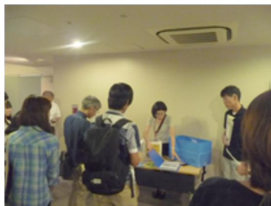
貸出教材キットの紹介