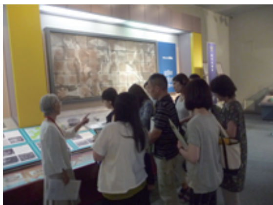
展示見学（ボランティアガイドの解説）