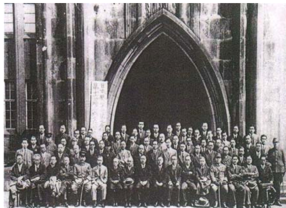
1942年(昭和17年) 第11回日本医学会総会時の第9部微生物学分科会の 東京大学安田講堂前での記念撮影