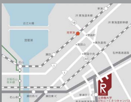
滋賀 びわこ・くさつキャンパス