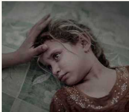
人々の部 単写真1位 イスラム国(IS)の恐怖と食糧難によってやむなく郷里を去ることになった5歳の子ども。「私には夢がない。もう何も怖いものはない。」と、静かに言う。 2016年9月18日 デバカ(イラク)