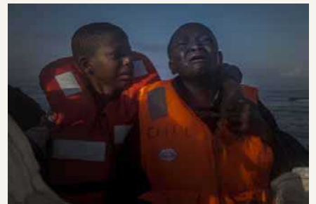
一般ニュースの部 単写真2位 地中海でイタリアに向かっていたすし詰め的小型船から難民船に移され、弟を元氣付ける11歳のナイジェリア人少女。母親はサハラ砂漠横断の末にリビアで亡くなった。欧州対外国境管理協力機関(FRONTEX)によると、北アフリカからイタリアに到着した難民数は2016年に過去最高の18万1000人を記録し、2万5800人が同伴者のいない子どもだった。 2016年7月28日 サブラタ(リビア)の北約23kmの地中海