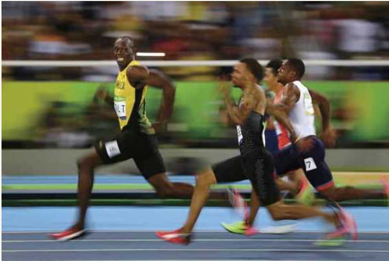
スポーツの部 単写真3位 ブラジル・リオデジャネイロ夏季オリンピックで100メートル準決勝に勝利し、後ろを振り向きながら笑顔を見せるジャマイカのウサイン・ボルト。ボルトは人類史上最速と言われており、完全自動計測が義務化されて以来初の100メートル、200メートル世界記録保持者である。 2016年8月14日 リオデジャネイロ(ブラジル)