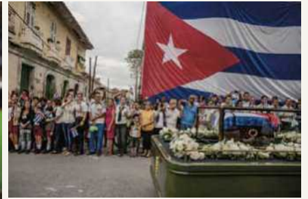
日常生活の部 組写真1位 キューバの前国家評議会議長(国家元首)で共産主義革命の指導者でもあったフィデル・カストロの葬列。国中が大いなる悲しみに包まれ、葬列を一目見ようと多くの人々が集まった。 2016年12月1日 サンタクララ(キューバ)