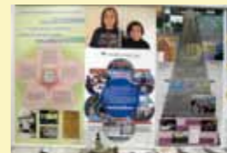
平和をつくる市民の力