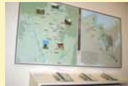
平和をはぐくむ京の人びと