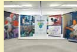
暴力と平和を考える

2階は、現在の世界にあるさまざまな問題や平和な世界をつくるための人びとの活動について展示しています。