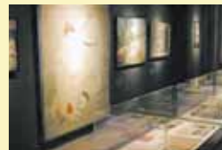
「無言館」/京都館一いのちの画室