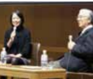
2009年度映画上映会トークショーの様子

2003年から恒例となったこの企画は、「平和」をテーマとした映画上映と国際平和ミュージアムの館長等が映画の製作に関わった監督や関係者から、その思いを直接聴く機会を作るという対談を組み合わせたものです。前期・後期各1回の上映を予定しています。