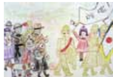
図画「出征兵士を送る」