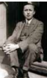
カレル・チャペック

チェコを代表する作家カレル・チャペック(1890—1938)は、文明批評家、SF作家、園芸家、愛犬家などとしての多彩な活躍で知られています。今展では、チャペックの歩みを紹介するとともに、彼の遺品や、チャペックとともに活動し、イラストや装丁作家としても活躍した兄、ヨゼフ・チャペックによる装丁本、関連資料などをあわせて展示し、カレル・チャペックの世界を紹介します。