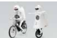
セイサク君とセイコちゃん