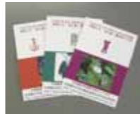
「平和ってなに色？」漢字カード

2005年文字・活字文化振興法の施行により、10月27日は「文字・活字文化の日」と制定されました。文字・活字文化についての関心と理解を深めていただくため、立命館大学白川静記念東洋文字文化研究所と連携して、文字・活字と、平和を楽しく学べる企画を行います。