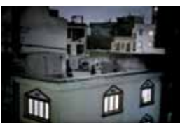
ビエトロ・マストルツォ(イタリア/2009) 6月24日、テヘランの建物の屋上からイランの現体制への抗議の言葉を叫ぶ女性

9/22 WED—10/16 SAT 京 都(立命館大学国際平和ミュージアム) 10/19 TUE—11/4 THU 大 分(立命館アジア太平洋大学) 11/7 SUN—11/23 TUE 滋 賀(立命館大学びわこ・さつキャンパス)