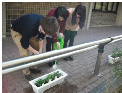
恒心館北にプランターを置きました

非みなさん、学生の思いと綺麗なお花を見にお立ち寄り下さい。そして、私たち教職員もより関心を持ち、学生が安全な環境で気持ちよく過ごせるキャンパスをつくっていきましょう。