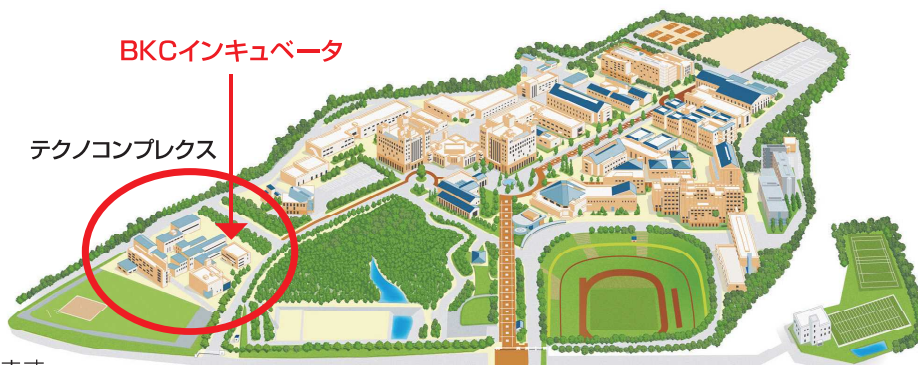
立命館大学びわこ・くさつキャンパス