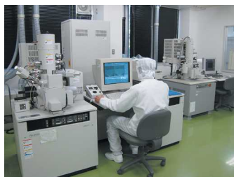
マイクロシステムセンター(解析室)