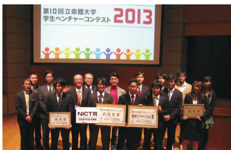
毎年開催のベンチャー・ビジネスコンテスト(対象:学生起業家)