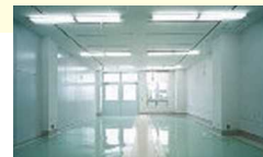
試作開発室タイプ