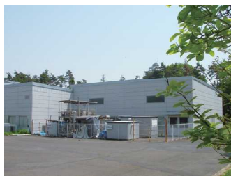
ハイテクリサーチセンター (エコ・テクノロジー研究センター)