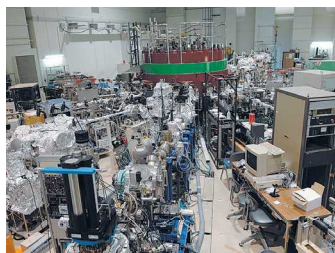
SRセンター(ビームライン)