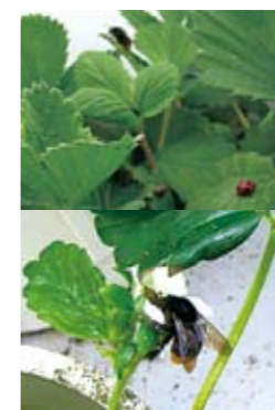
テントウムシとクロマルハナバチ

これを実現するために2009年11月、研究棟に約50㎡の試験工場を設置し、実験栽培を開始しました。室内では、温度を昼間は20℃、夜間は10℃、湿度を70%に設定し、授粉用にマルハナバチを、また害虫駆除用にテントウムシを放し飼いにしています。ここに多様な土壌環境を設定して窒素やリンを豊富に含む馬ふん堆肥を施用し、イチゴの生育状況を調べています。栽培には、別の研究で実効性を証明したパイオマス由来の植物成長資材である ペプチド (注3)も活用しています。