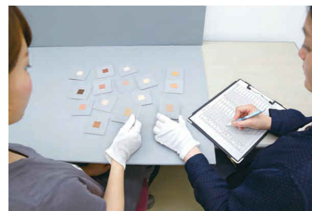
顔色についての言語表現に関する実験の様子