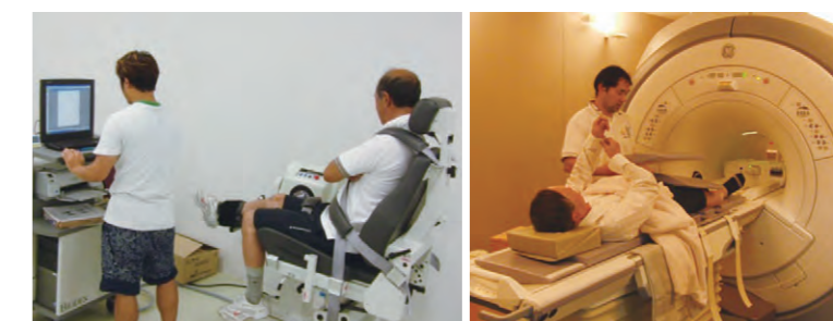
筋機能と筋量の評価

現状でのBiodexを用いた筋機能の評価(左図)とMRIによる筋量の評価(右図)