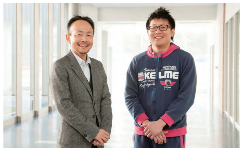
[写真左] スポーツ健康科学部 教授

その他にも筋肉合成に効果が見込まれるさまざまな食品素材について、運動との併用効果を検討しています。また食品や食品素材メーカーと共同研究で新たな機能性食品の開発も進めています。最終的には、一人ひとりの筋肉応答性に対応した効果的な運動と栄養摂取の方策の開発につなげていきたいと考えています。