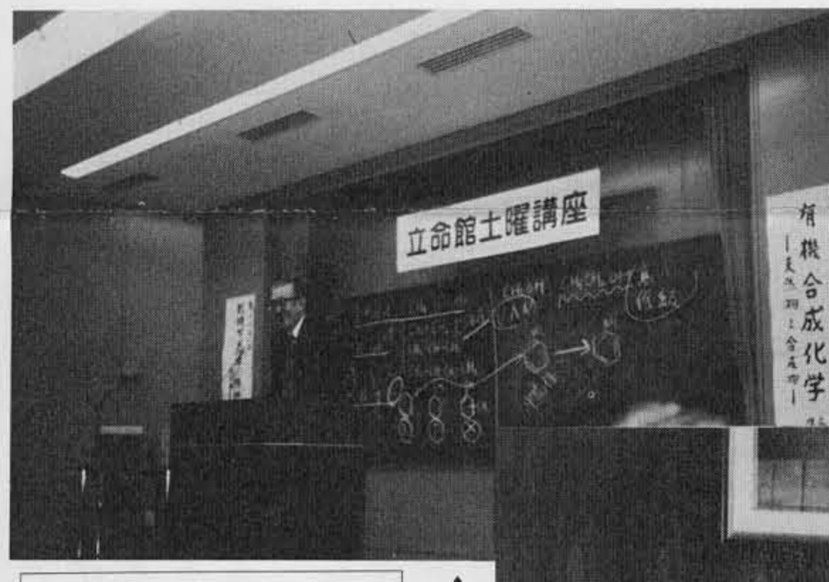
▲昭和60年立命館土曜講座で講演

略歴 昭和二十年京都大学工学部工業化学科卒業。昭和二十一年立命館専門学校講師。三十七年立命館大学教授。理工学部主事、理工学部長、教学担当常務理事、図書館長、硬式野球部長を歴任された。