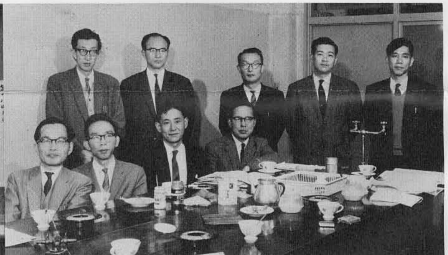
▲昭和36年頃 化学科教員とともに