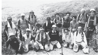
第15回応化会ハイキング (京都・大文字山)

任期中、最も楽しい思い出は、記念すべき創立二十周年記念事業を推進する機会に恵まれ、諸先生をはじめとし、多くの校友の皆様と久しく二十周年をお祝いし喜びを共にし、皆様のご協力を得て記念誌（創立二十年の歩み）の発行に関わって来たことであった。終わりに、歴史のある応化会の母体を引継ぎ、新たな同窓会組織の誕生を祈念しております。