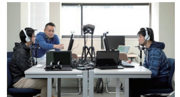
右：対話エージェントを用いた認知的コミュニケーション支援の様子。