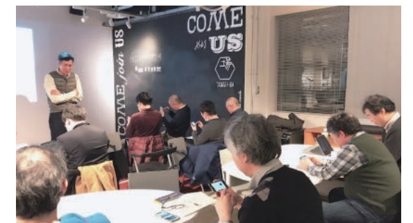
右：コロナ禍前にJR京都駅前行われた研究会の風景。