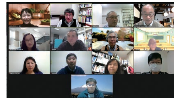
左：最近行われたズームによる研究会の記念写真。

研究・開発・技術に関する個別の課題に対する会員提案型分科会または勉強会を開催し、社会に役立つ新製品を提案する。その手始めとして「力触覚技術応用コンソーシアム」を4年前より立ち上げており、大学のインフラをベースに、諸企業の技術と情報を取り入れ還元することによって社会的貢献をめざす。