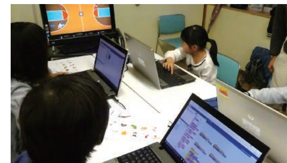
左：プログラミングをゲーム感覚で協力的に学ぶ子どもたち。