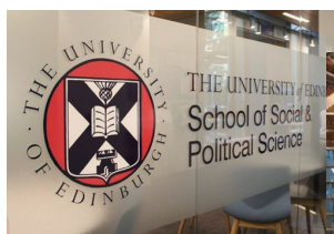
エディンバラ大学政治学研究科

エディンバラはスコットランドの首都で、北緯約 56 度の北極圏にあたります。緯度はモスクワよりも北ですが、東側に接する北海の暖流の影響で冬の最低気温はマイナス 1 度ほどで、雪は降りません。ただ、風速 15m 以上・最大 20m など暴風の日が多く、大学やスーパーへの行き来で、向かい風の抵抗で