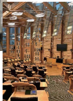
スコットランド 議会議事堂