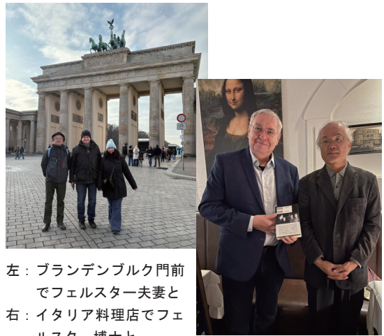
左：ブランデンブルク門前でフェルスター夫妻と 右：イタリア料理店でフェルスター博士と

シュレーゲルベルガーは、帝政時代の農業労働者の権利状況に関する社会調査を踏まえて、それに対応する法制度を考案し、またワイマール共和国を貧困と頹廢のどん底に追い込んだインフレを終息させるために財政・金融政策を主導し、行政官僚として才覚を發揮しました。議会や政府が目前の問題に手を拱いていたとき、正法の理論に基づいて債務額の増額評価に踏み切った帝国裁判所の判断を指針にして行政主導で法改革を推進しました。裁判官出身の行政官僚のシュレーゲルベルガーがそのような行動に出た背景には、議会政治をめぐる合従連衡を繰り返す連立政府の無為無策と議会制民主主義の未成熟があったようです。それは人文主義の教養と伝統的な法律学の知識を身に着けた旧時代の裁判官と官僚法曹の連携こそがドイツ社会の安定化と発展を支えるという法学エリートの驕りでもあります。それは第三帝国において全面的に發揮されたといえます。