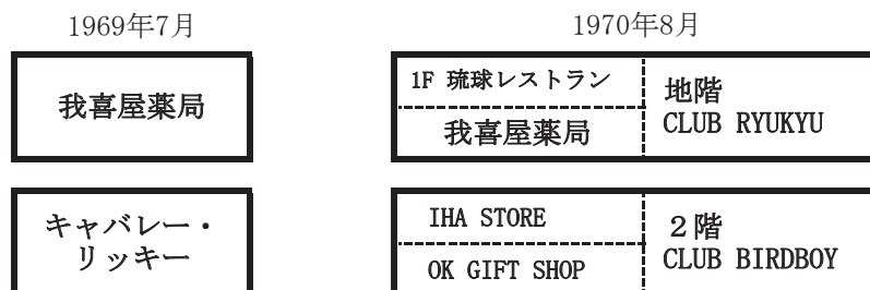
第2図 先行研究と本稿の表記の違い

石原ゼミナールで「我喜屋薬局」としている建物には、実際のところ3つの事業所が入居してい