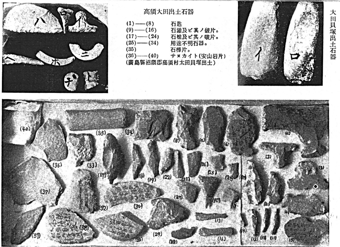
図2 神武天皇聖蹟の証拠として掲載された広島県大田貝塚出土遺物 * (高田 1939) より引用

所在する備後は、現状でも備前・備中に遜色ないと述べる。しかも、考古学研究が備前・備中に比べて遅れているので、今後、遺跡数がさらに増える可能性が高いと述べる。