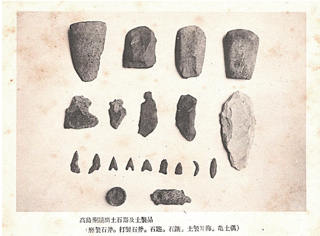
図3 神武天皇聖蹟の証拠として掲載された岡山神島外村（高島）出土遺物 *（鶴久森 1943）より引用

定していれば、その存在も神武天皇滞在の証拠として、有効に機能したはずである。神武天皇が滞 在する場所は無人の地ではなく、そこに先住民が居住していなければ、「征服」する意味がない。 高島宮に神武天皇が3年間以上、長期間滞在したからには、そこに多くの先住民が住んでいたはず である、と考えるのは自然なことである。