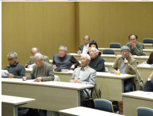
パネルディスカッションにおける質疑応答の様子。活発なやり取りが展開された。