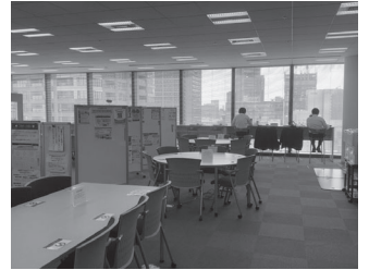
大阪梅田キャンパス