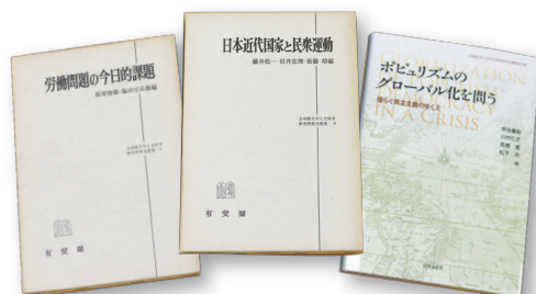
立命館大学 人文科学研究所研究叢書を刊行