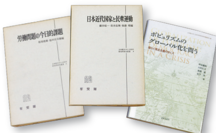
Ritsumeikan University Publication of Research Publications of Institute of Humanities, Human and Social Sciences