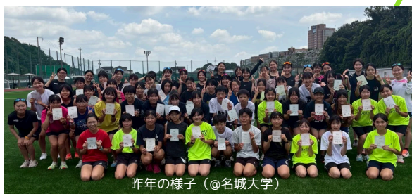
昨年の様子 (@名城大学)

大学女子長距離競技者が減少していることに危機感を持ち、 大学でも競技を続けたいと思う 後輩たちを増やしたいという 想いがあります。 イベントを通じて走る楽しさを伝えていき、 大学女子長距離界を 盛り上げたいというのが 私たちの願いです。