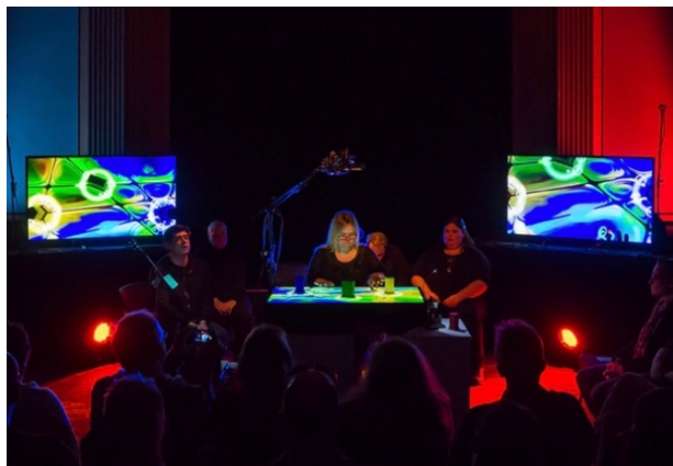
アンプリファイド・エレファンツ