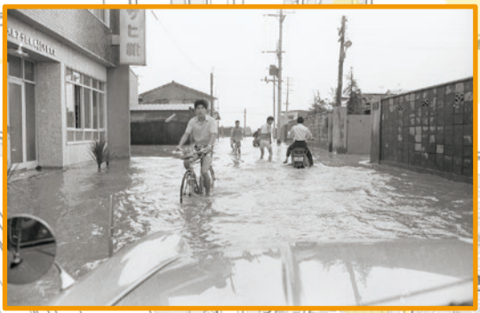
昭和42年7月北摂豪雨時の市内の様子

浸水の深さ (内水ハザードマップ) 一身近な水路や下水道があふれる内水氾濫— 過去に他地域で起こった最大級規模の大雨(市全域で最大1時間雨量146.5mm)を想定し作成されたものです。河川の氾濫は考慮されていません。