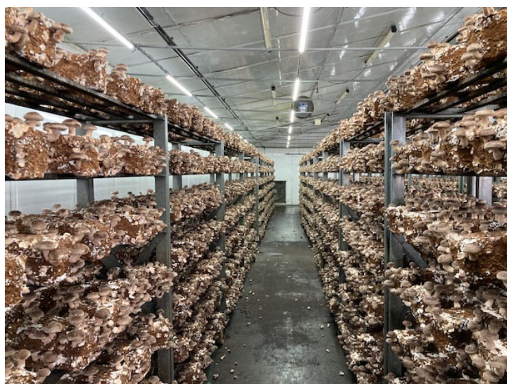
（上野村きのこセンター）

きのこセンターは、1999年（平成11年度）に第3セクターとして開業し「安全・安心・健康」をテーマに栽培される質の高い椎茸がお客様の人気を呼んでいます。「菌床」からニョキニョキと生える椎茸が巨大な棚に並ぶ風景は圧巻の一言。