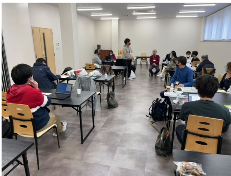
(グループワークの様子)

プログラムの最後は、2日間のフィールドワークを踏まえてのグループディスカッションを行いました。「魅力あふれる村づくり（サステナブルツーリズム）」「自律した循環型の村づくり（サステナブルビジネス）」「住み続けたい村づくり（サステナブルライフスタイル）」の3つのテーマに沿ったチームで、提案の方向性を議論しました。ディスカッション後の共有タイムでは、受講生の多くから「事前に立てた仮説が、実際に現地でのフィールドワークによって間違っていることを実感した」「地元の皆さんとの対話を通じて、新たな視点を得た」という声が出ました。