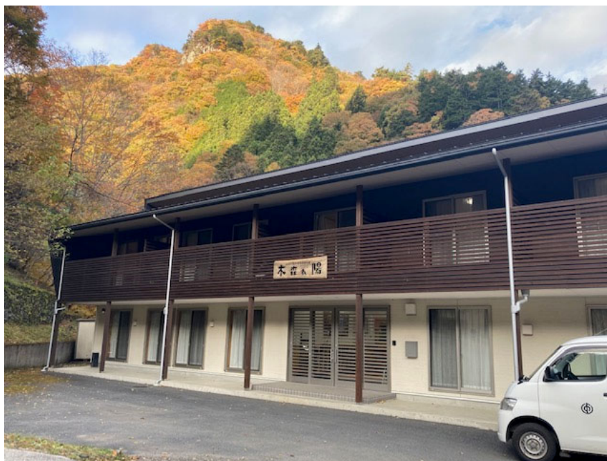
(上野村体験学習の家「木森れ陽」)

受講生が宿泊したのは、上野村自然体験学習の家「木森れ陽」。村の豊かな自然を活用した森林セラピーなどの自然体験や環境学習の拠点となっています。