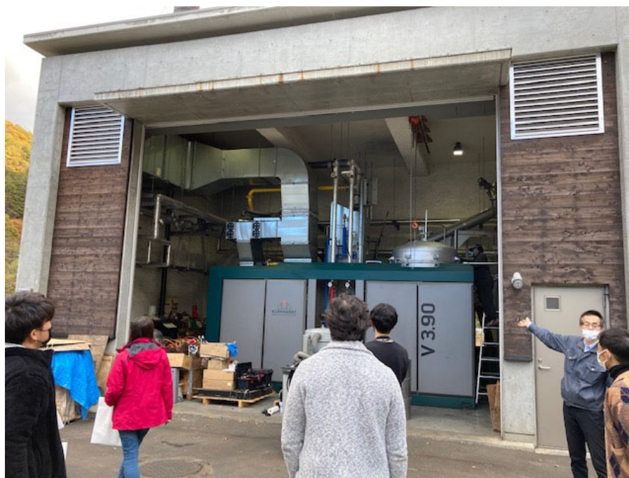
(木質バイオマス発電工場)

実は、この3つの施設は「上野村型循環型社会」をささえる重要なインフラ。森林組合によって伐採される木材の一部がペレット工場で製品化され、きのこセンター内の木質バイオマス発電に活かされているのです。