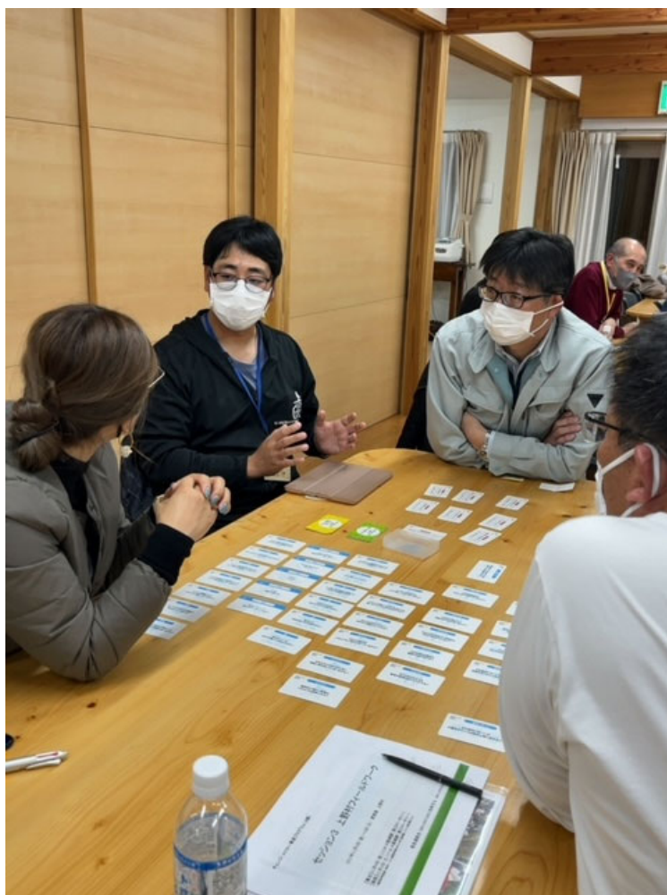
(リフレクションワークショップの様子)

ワークでお互いの関係が温まった後は、バーベキュー大会を開催。村の特産品である、イノブタや野菜を食しながら、夜遅くまで語らいが続きました。