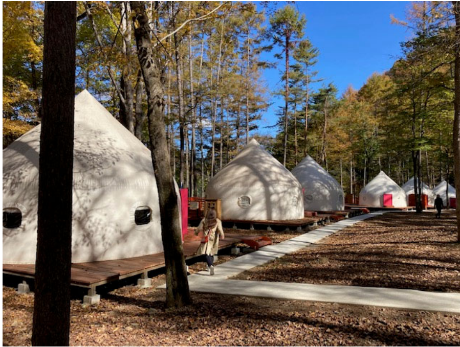
(「まほーばの森」内のグランピング施設)