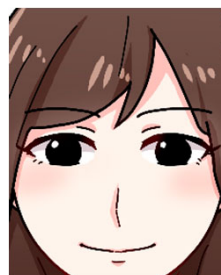
写真いっぱい顔が写っている