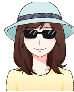
サングラス、帽子を着用している