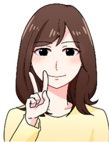
顔が手で隠れている