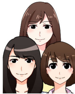
複数人で撮影されている