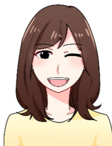
普段の表情と異なる