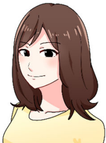
正面を向いていない