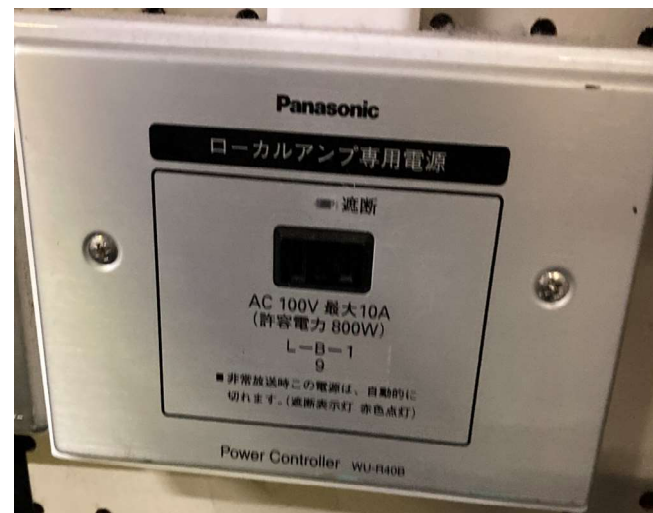
カトリレーコンセント@学生会館各所

※非常放送起動時は自動で電源が遮断され、 非常放送の鳴動を優先させることができます。