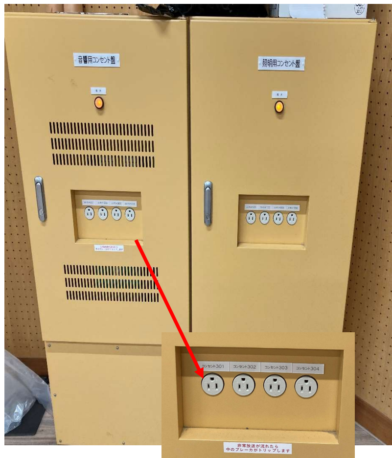
音響用コンセント盤@ミュージックホール