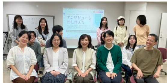
パネルディスカッション「インタビューを考える」 2025 年 10 月 13 日