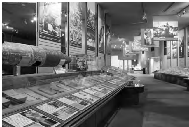
地階展示室内「現代の戦争」

2021年4月よりリニューアル休館しています。2021年度春学期まで立命館大学関係者のみ見学を受け入れる予定でしたが、新型コロナウイルスの影響で学内見学についても休止期間が長く続き、見学団体は6団体にとどまりました。常設展示場に展示していた博物館資料などは12月から梱包を開始し、2月には外部の美術品専用倉庫に保管が完了しました。