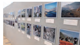
「井戸も掘る医者・ベジャール会の医療活動・緑の大地計画」展示の様子