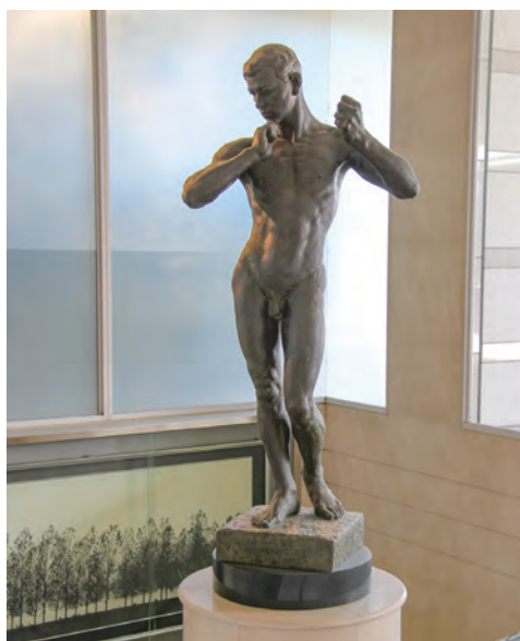
立命館学園の教学理念「平和と民主主義」の象徴である「わだつみ像」はリニューアル工事期間中、衣笠キャンパス平井嘉一郎記念図書館内に設置されます。

2022年度からの本格的な工事の開始にむけて、博物館資料は学外の倉庫へ、ミュージアムオフィスは洋館へ移転しました。