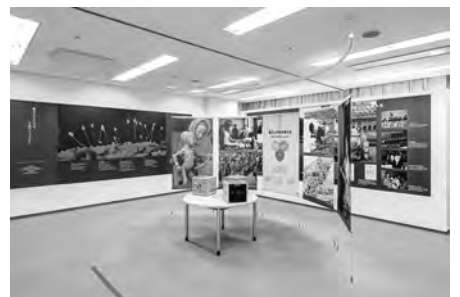
写真記録から現在までの常設展