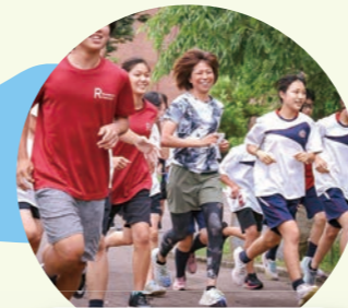
オリンピック元日本代表選手(福士加代子選手)に学ぶ!