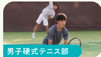
男子硬式テニス部