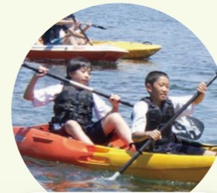
琵琶湖でSDGsを学ぼう