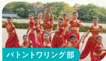
バントワリング部