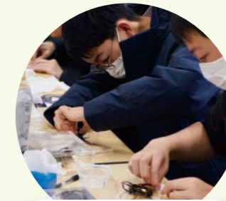
昆虫標本を作ろう