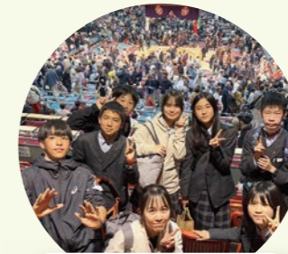
大相撲を観覧し 伝統・文化を学ぼう