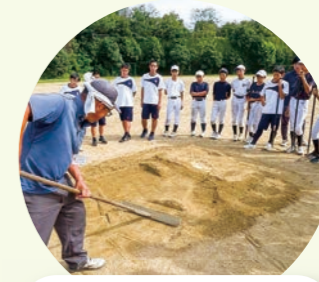
阪神園芸さんに学ぶ グラウンド神整備