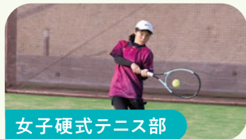
女子硬式テニス部