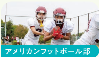
アメリカンフットボール部