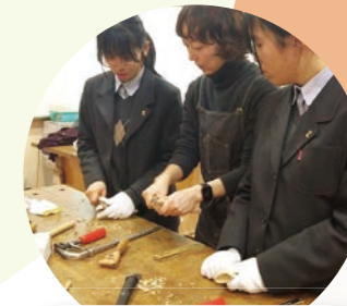
木彫りスプーン作り