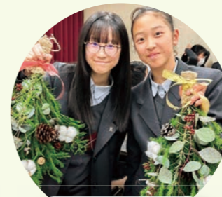
スワッグを作ろう