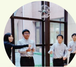
AIとプログラミングで学ぶ 防災体験講座