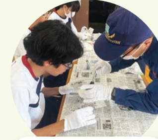
鑑識のお仕事体験