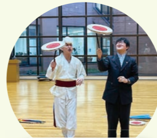
民族楽器 ~世界の音に出会おう~