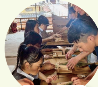
祇園祭 鉾見学と粽(ちまき)作り