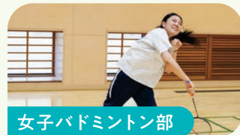
女子バドミントン部