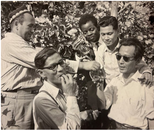
（管理番号 352）