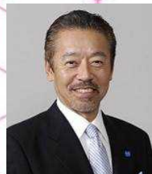
【コーディネーター】 堀場 厚 氏 堀場製作所会長兼社長

開催日時：2014 年 5 月 31 日(土) 14:00～17:40 (受付開始 13:30)