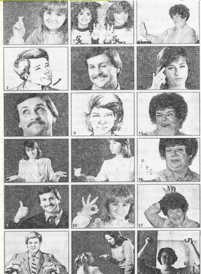
(No. 1~12・14 は東山『Gestures』『カラーアンカ英語大辞典』学研より)

#では典型的な英語圏ジェスチャーの理解度テストもやってみましょう。(ハンドアウト2)