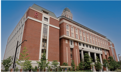
立命館大学朱雀キャンパス

立命館大学朱雀キャンパス1階リーガルクリニック室 ※完全個室となっておりますのでご安心ください