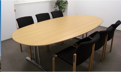
相談室(リーガルクリニック室)