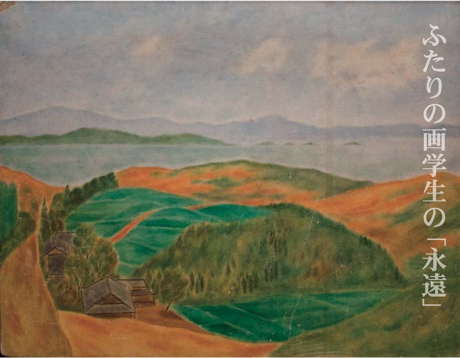
「海をのぞむ」手島守之輔（戦没画学生慰霊美術館「無言館」蔵）